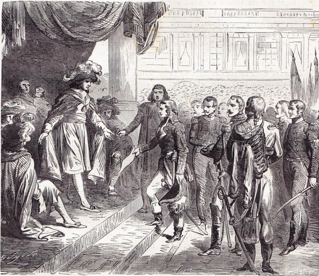
Bonaparte reçu par le Directoire à son retour d'Italie.

Ces deux armées venaient de se réunir, et Souwarow, qu'on appelait l' Invincible , commandait alors 90 000 hommes austro-russes qui forcèrent le passage de l'Adda (27 avril) au moment où Schérer, sentant son incapacité, remet-