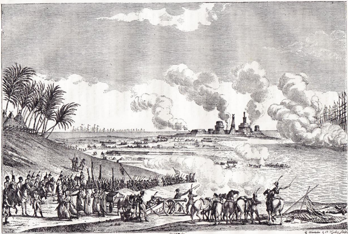
Bataille d'Aboukir (1 er août 1798). (Fac-simile d'une estampe du temps.)